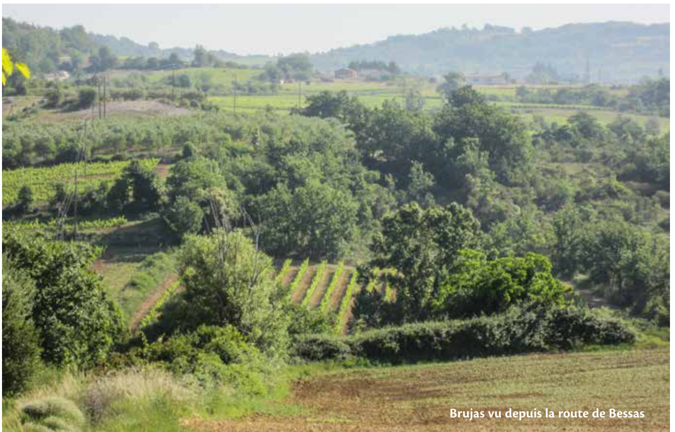
Brujas vu depuis la route de Bessas