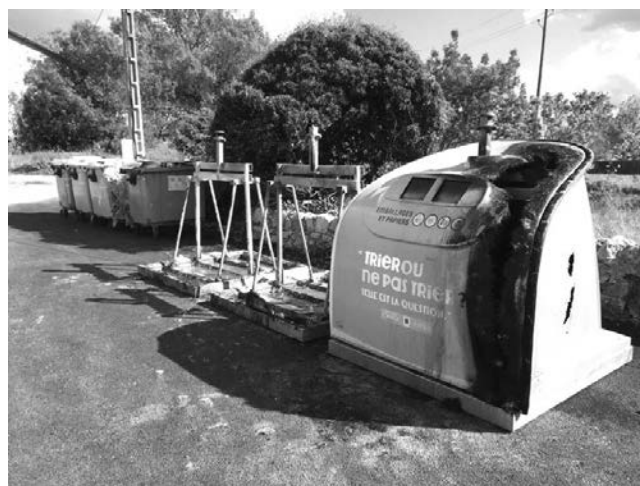
Les nouveaux conteneurs à ordures ménagères disposés près de la fontaine de La Pomme ont été incendiés en avril dernier.

Une pétition a circulé dans notre commune et a recueilli plus de 250 signatures. Déposée à la mairie, le maire et ses trois adjoints sont allés la remettre au président de la communauté de communes et lui ont signalé l'opposition unanime du conseil municipal à ce