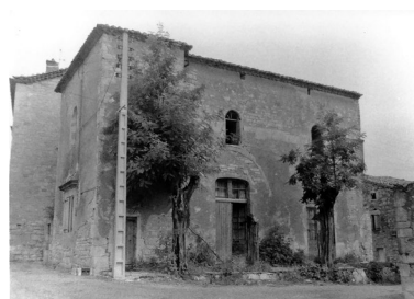
1979 - ND-fontaines

Quarante ans plus tard, il était temps de lui redonner une nouvelle jeunesse et, pour Vagnas, de retrouver son ancienne église romane.