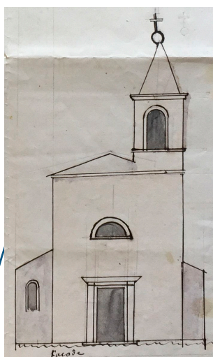
1825 - la façade

En 1628, Louis XIII fait dessiner les Places fortes protestantes du Vivarais avant de mener ses troupes à l'attaque. Vagnas, son enceinte et son église dessinée ruinée sont dans la liste.