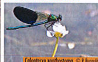
Colopteryx xanthostoma .

Alors qu'une étude d'inventaire est actuellement menée sur le site Natura 2000, une