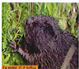
Le castor.

Autrefois répandu en Europe, le Castor a connu un fort déclin du fait de l'intensité de sa chasse et de son piégeage. En 1968, il devient le premier mammifère protégé en France et recolonise le territoire. L'aptitude du Castor à moduler son environnement pour lui mais aussi pour d'autres espèces fait de lui un « ingénieur des écosystèmes ». Il favorise ainsi le maintien de la biodiversité. L'étude venant d'être menée en aval de l'Ardèche statue la stabilité de la population présente depuis plus de 10 ans.