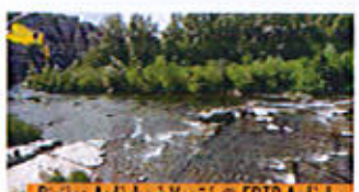
Rivière Ardèche à Yogüé

L'Établissement public territorial du bassin versant de l'Ardèche vous invite donc à un été 2023 sous le signe des économies d'eau, de la vigilance et de la préservation de nos rivières. Retrouvez toutes les infos de l'été sur Ardèche In'Peau Plage ( www.qualite.ardèche-eau.fr ).